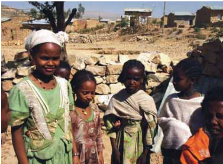
Trivelege born i landsbyen Tukul i Tigray.

– Møtet med denne gigantiske hovudstaden var litt skremmande. Mellom anna på grunn av det afrikanske toppmøtet krydde det av væpna vakter.