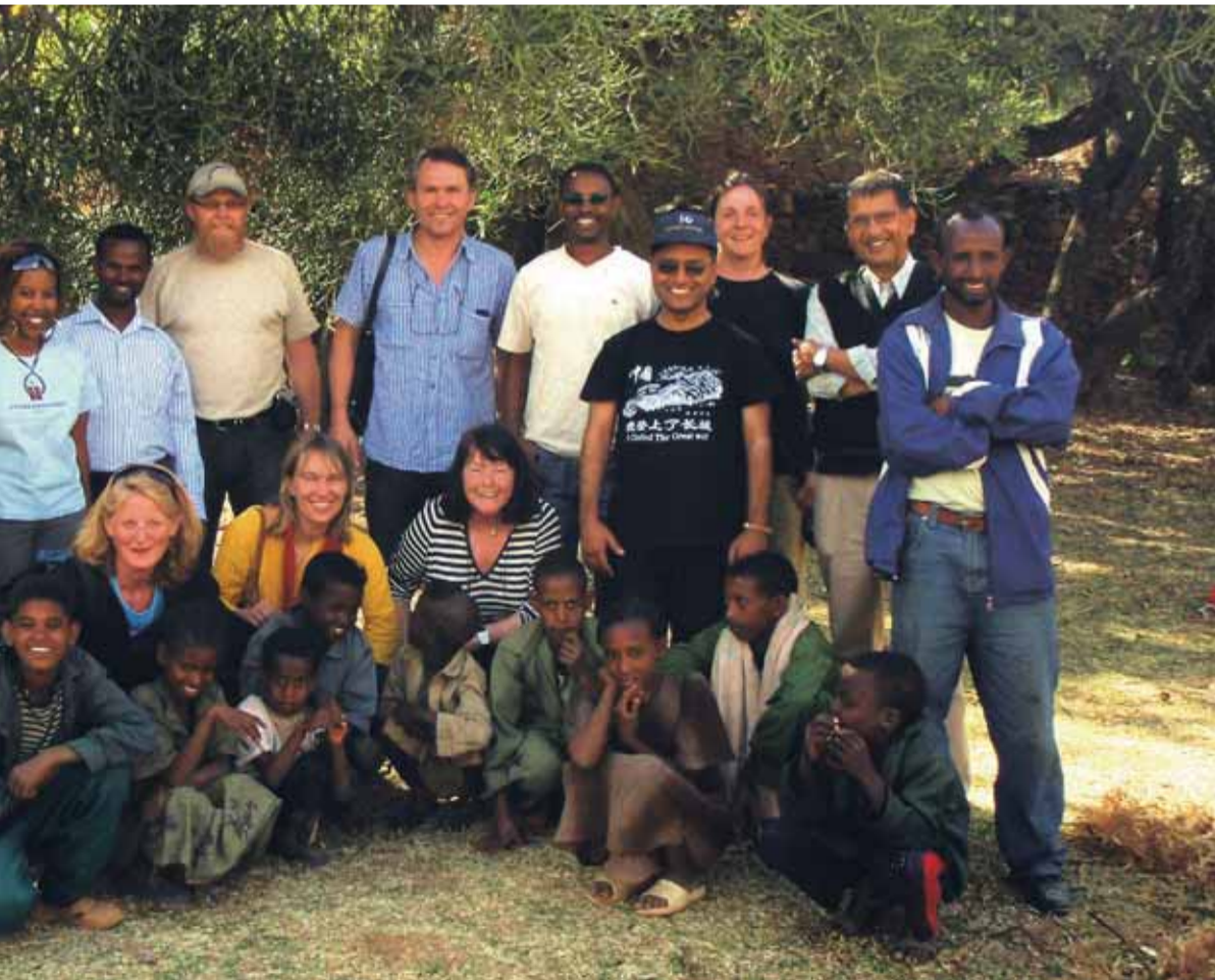
Symfaring på eit vassprosjekt REST arbeider med. Det var alltid ei gruppe ungar som gjerne ville vere med på biletet.

råde for både Utviklingsfondet og dei lokale organisasjonane. På flyet sørover til Addis Abeba hadde vi merke til at dei reisande hadde med seg store kjerald med honning.