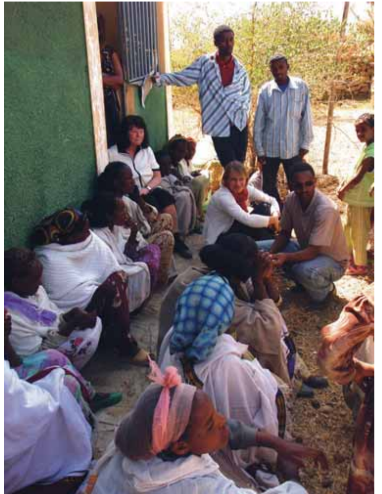
Når møta foregjekk ute var det godt å søkje skuggen. Her frå eit møte med eit lokallag av Women's Association of Tigray.

– Ein lokal leiar i REST, følgde oss til mange interessante lokalitetar og overalt vart vi mottekne med smil, interesse og