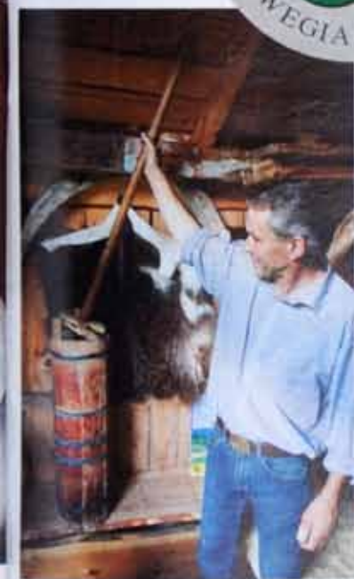
△ Gammelt redskap, brukt til å kinne smør.